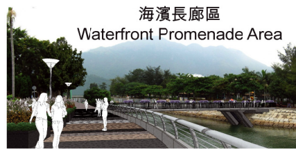
海濱長廊區 Waterfront Promenade Area