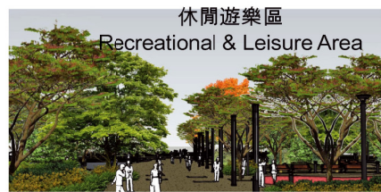
休閒遊樂區 Recreational & Leisure Area